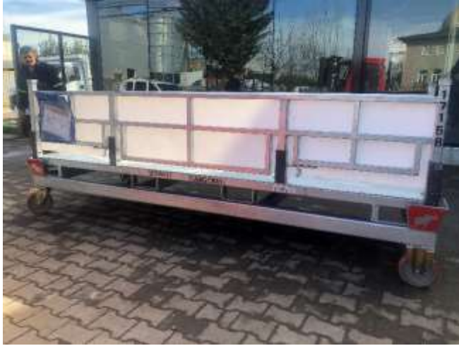
SCHMITZ – DOLLY İMALATI