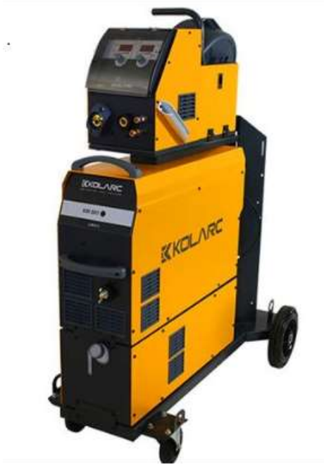
SİNERJİ MİG KAYNAĞI