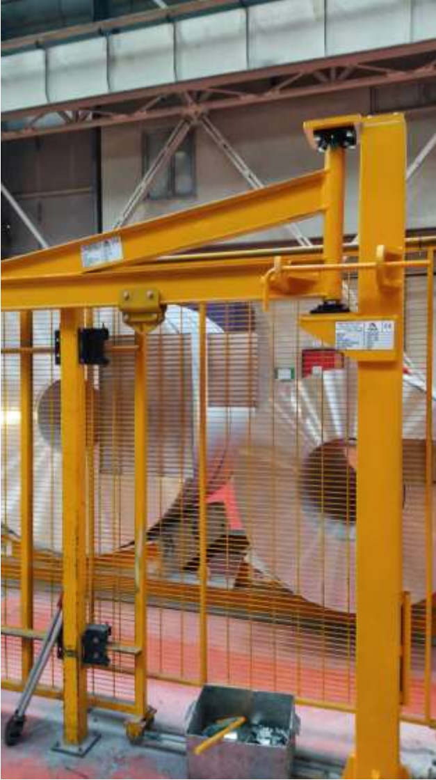
ASAŞ – 500 KG PERGEL VİNÇ - CE