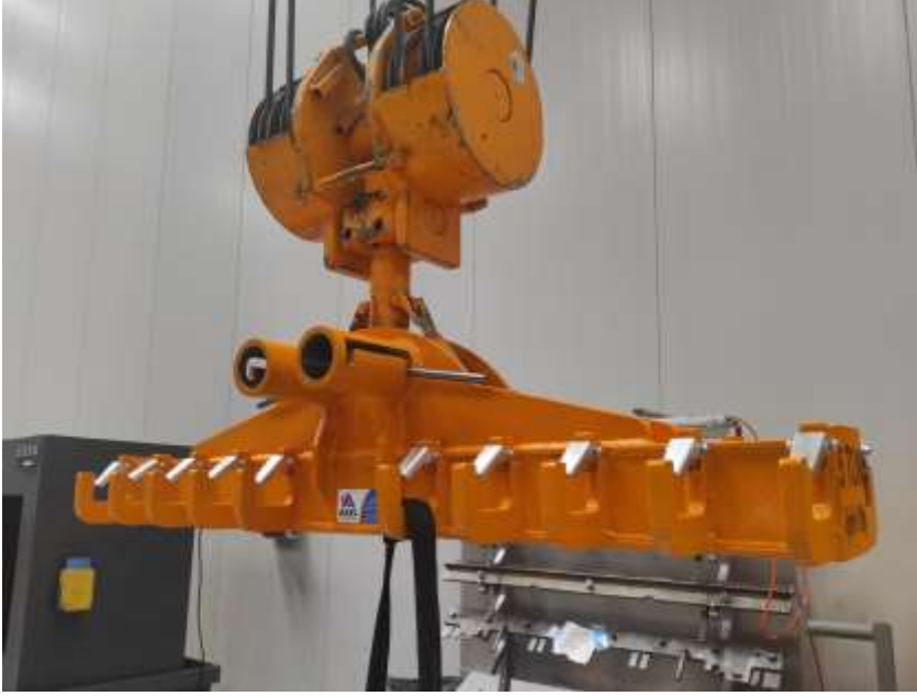
ASAŞ - 5 TON KALDIRMA APARATI – CE BELGELİ