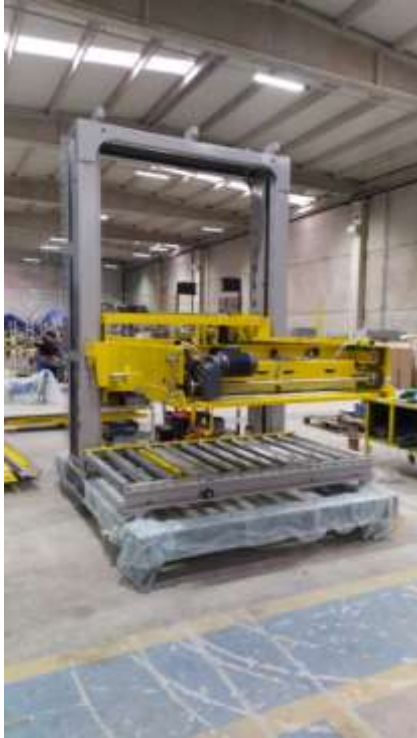
OPTİMAK – STREÇLEME MAKİNASI