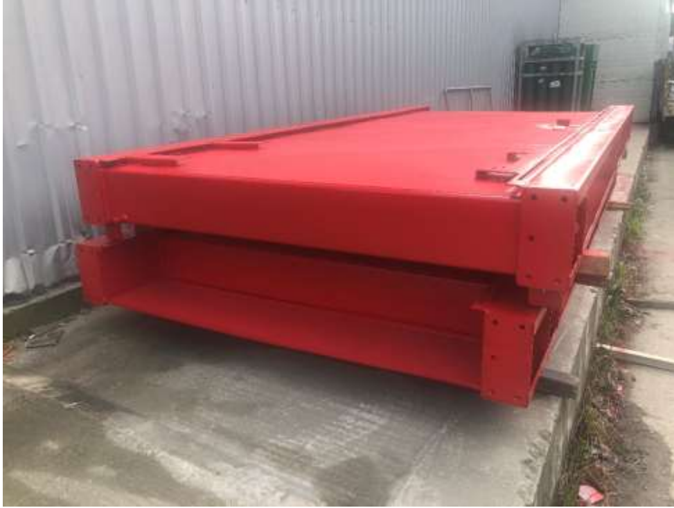
BAŐAK TRAKTÖR – YAĐ TANKI