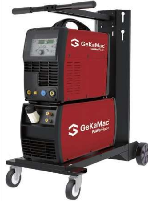
TİG KAYNAĞI (ALÜMİNYUM & PASLANMAZ)